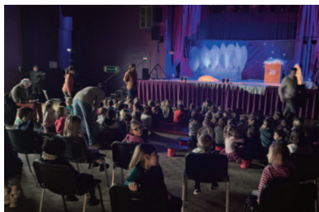
Spectacle Scolaire - Décembre 2024