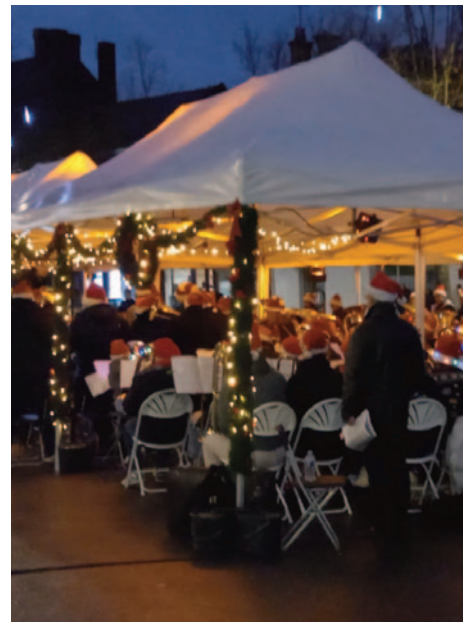
Brass Band de Noël - Décembre 2024