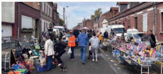
Foire de Moreuil 27 Octobre 2024