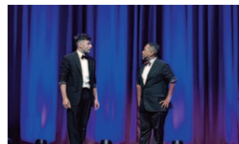
Spectacle Vice Versa - Sept. 2024