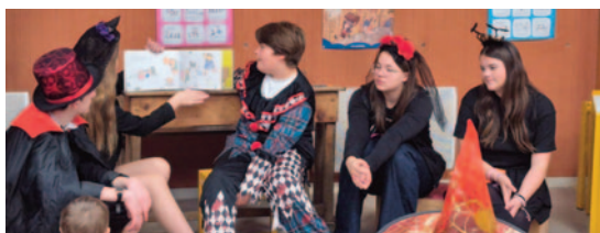
Malle aux jouets - Octobre 2024