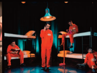
Spéctacle d'humour "8m 2 "