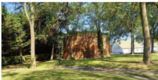
Journée du Patrimoine - 21 Septembre 2024