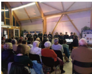
Concert et Chorale LASISOL - Nov. 2024