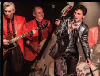
Concert du groupe "Les vinyls"