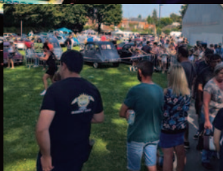
Moreuil en fête