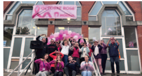
Octobre Rose - 2024