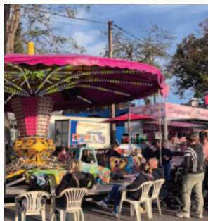
Fête forraïne - Octobre 2024