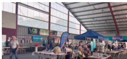
Forum - 1 er Septembre 2024