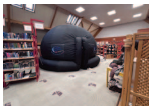
Fête de la Science - Oct. 2024